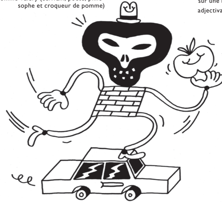
Promenades et vanités, par Orian